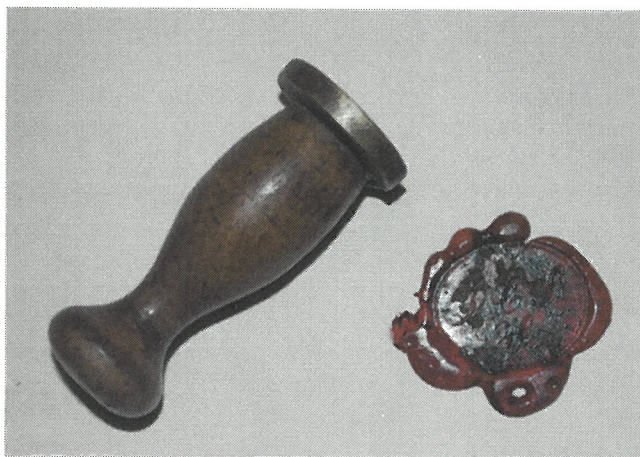
Oldefars signet med lakstempel – længden på signeten 5,5 cm. Initialerne siger nu Jens Christian Sørensen Højrup.

Ordbog over det danske sprog: Signet: lille plade med eller uden skaft, hvormed man trykker sit navnetræk i lak på et dokument.