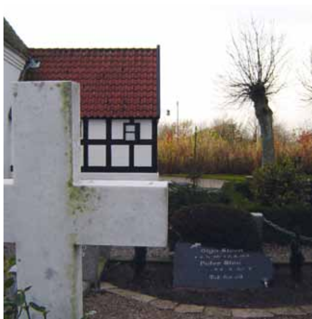
Asdal Kirkegård – sorgens og håbets have.

I november samles bibelkredsene torsdag den 5. november. Den 12. november kl. 19.30 er der fællesgudstjenesten i Sct. Catharinæ kirke i Hjørring. Den 26. november klokken 19.30 er det "vores egen aften". Og vi slutter november af med et bedemøde den 30. november klokken 19.30.