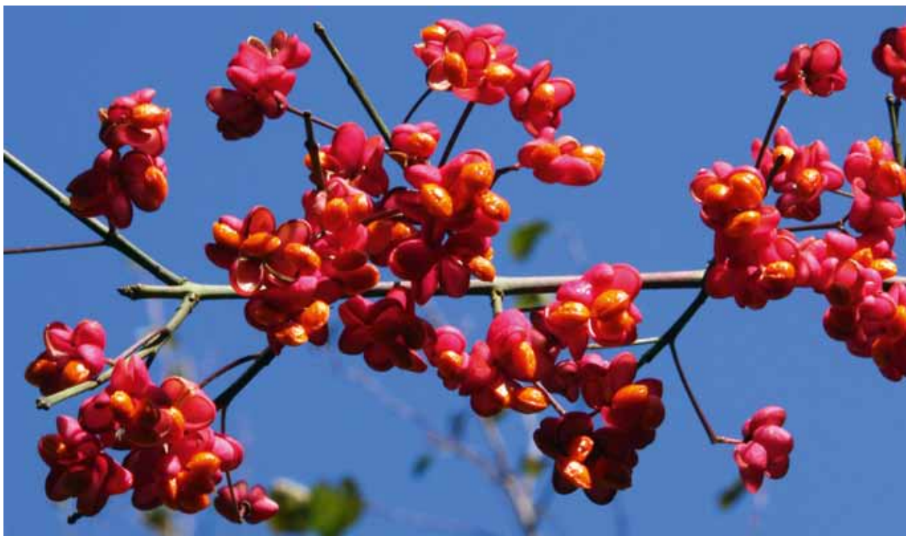
Bened i efterårsfarver. Motiv fra præstegårdsskoven i Horne.