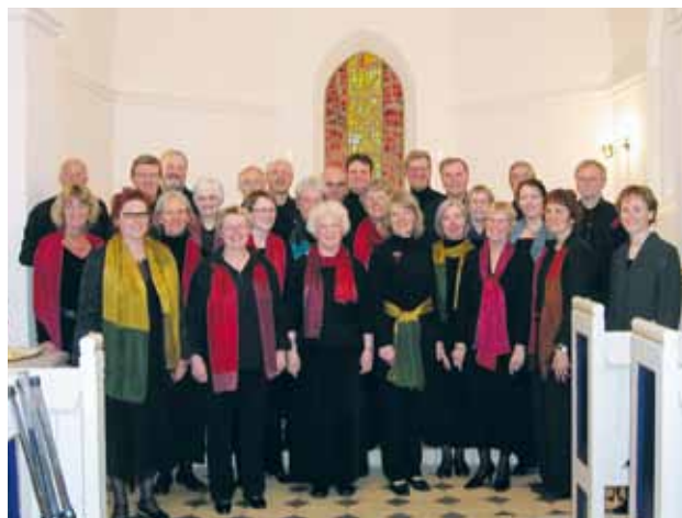
Traditionen tro spilles julen varm med besøg af Hjørring Kammerkor.

Der er møde i aktivitetsklubben onsdag den 16. december kl. 14.00 , hvor vi har julemøde, og onsdag den 20. januar kl. 14.00 grønlandsk kaffemik med korsang.