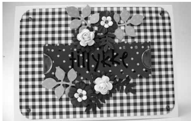
Eksempel på hvad der kan laves.