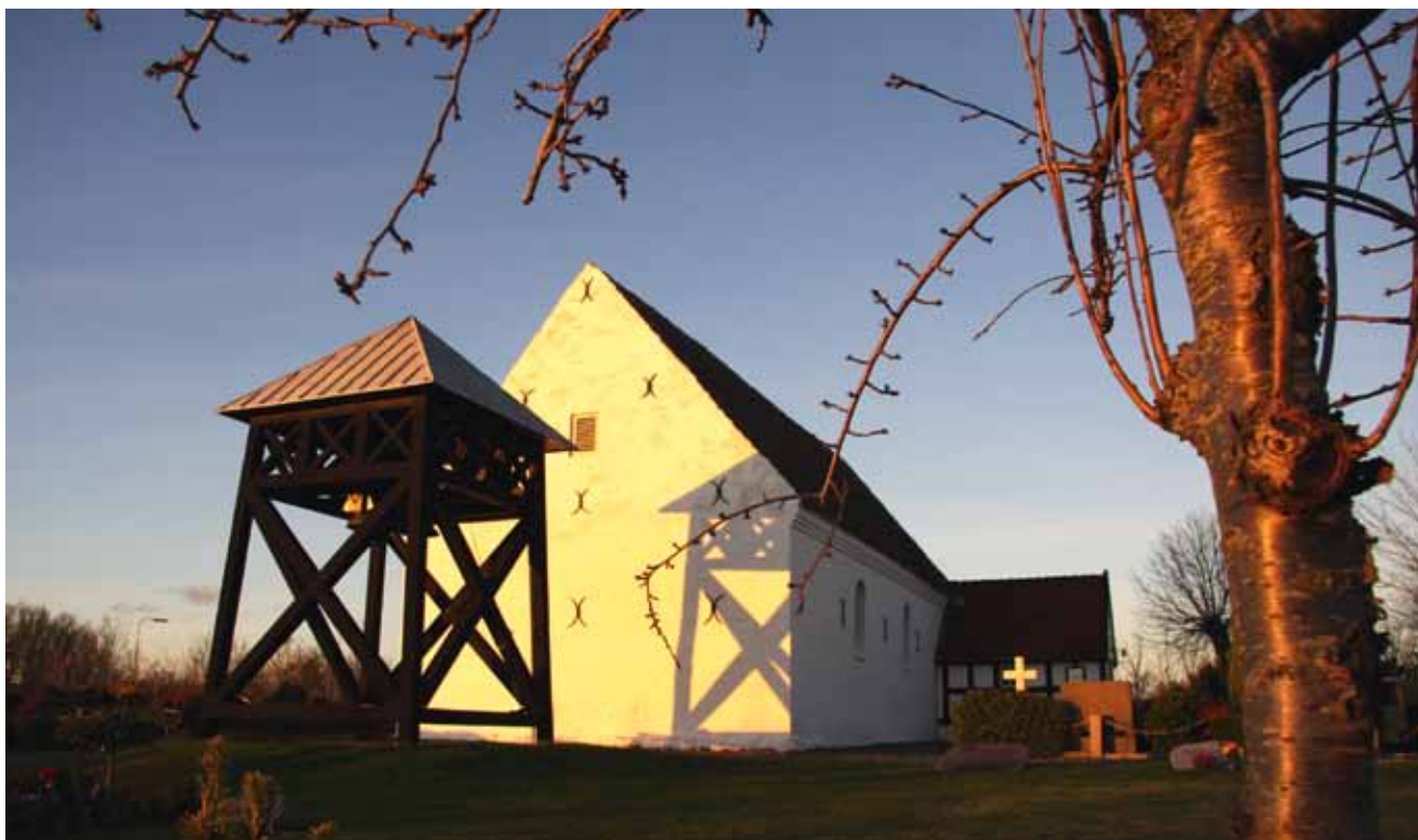
Asdal Kirke set en morgenstund i november 2008.