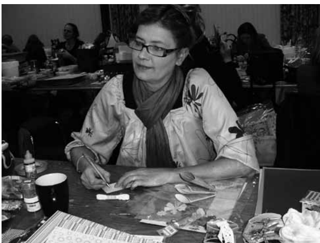
Helle, en garvet scrapper.

Vi glæder os allerede til foråret, hvor der igen bliver Scrap-amok i Sognegården.