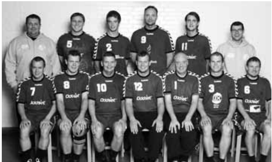
Serie 1 herrer

Med JHF i ryggen er det blevet en tradition, at vi arrangerer strandhåndbold for ungdomshold på Kjul Strand. I år var det søndag den 7. juni. Det startede med særdeles koldt vejr om formiddagen, men det blev varme, og alle havde en rigtig fin dag.