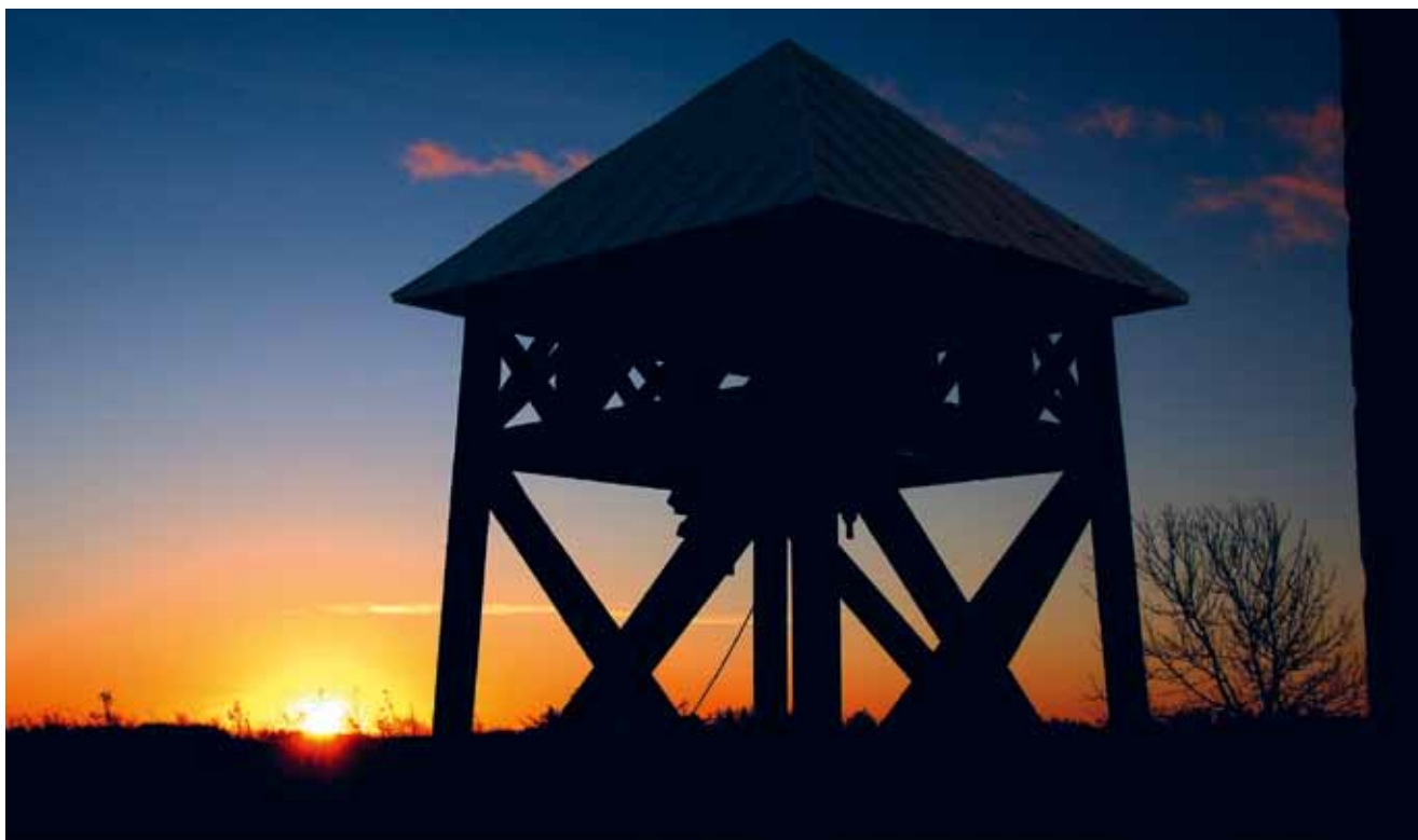
I østen stiger solen op... - Motiv fra Asdal Kirke.