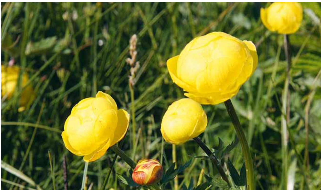
Engblomme er en smuk sommerblomst, men i dag et sjældent syn!