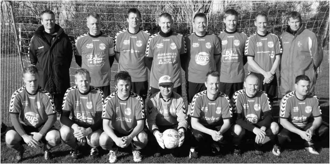
Holdbillede 2010 – 2 x Far og søn på holdet.

ken undskyldning der er for et nederlag på hele 8-2 skal være udsagt. Men for tilskuerne var det åbenlyst at Hirtshals U19 specielt i anden halvvej løb om hjørnerne med Asdal. De unge fra Hirtshals var lynende hurtig og de noget ældre Asdal-spillere, hvor flere kunne være far til hele Hirtshals-holdet, måtte erkende at manglende hurtighed nok kommer med alderen.