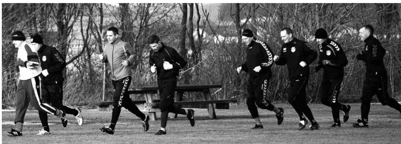
Standerhejsning 2011 – her er vi så alle sammen – 8 stk.

Den anden træningskamp var mod Hirtshals U19. Hvil-