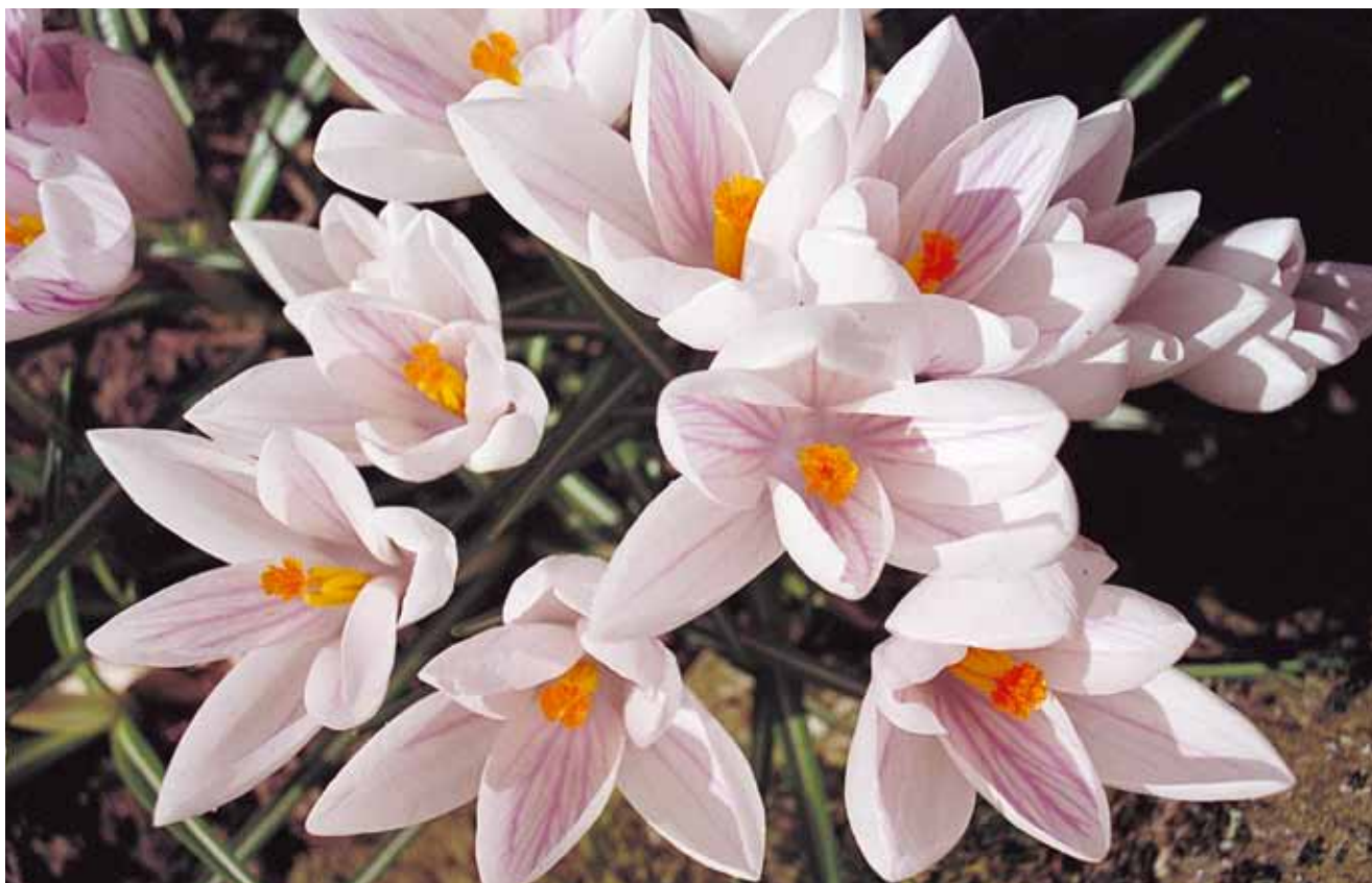
Atter er foråret smykket med farverige blomster.