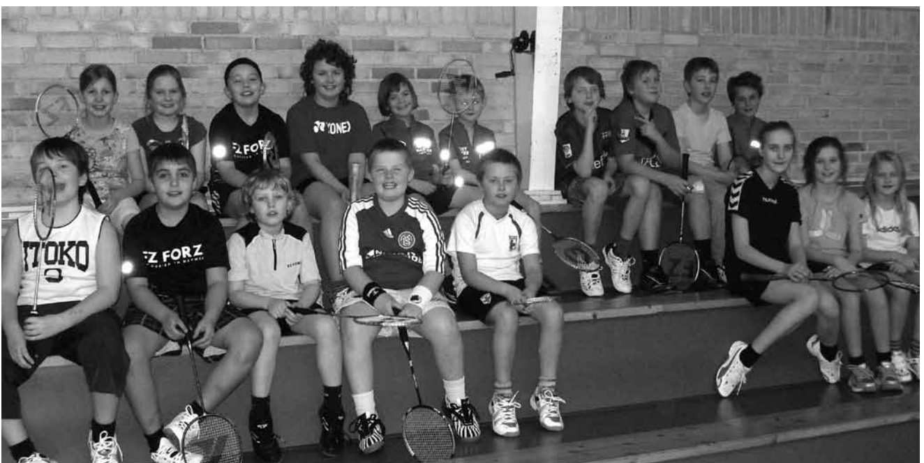
Asdal IF's badmintonbillede er hold U9 og U11

Sæsonens sidste holdfoto 2010 blev nærstuderet og her kan vi bryste os af hele "2 x far og søn" på holdet. Det vel og mærket alle som yderst aktive spillere på sidste års serie 4 hold.