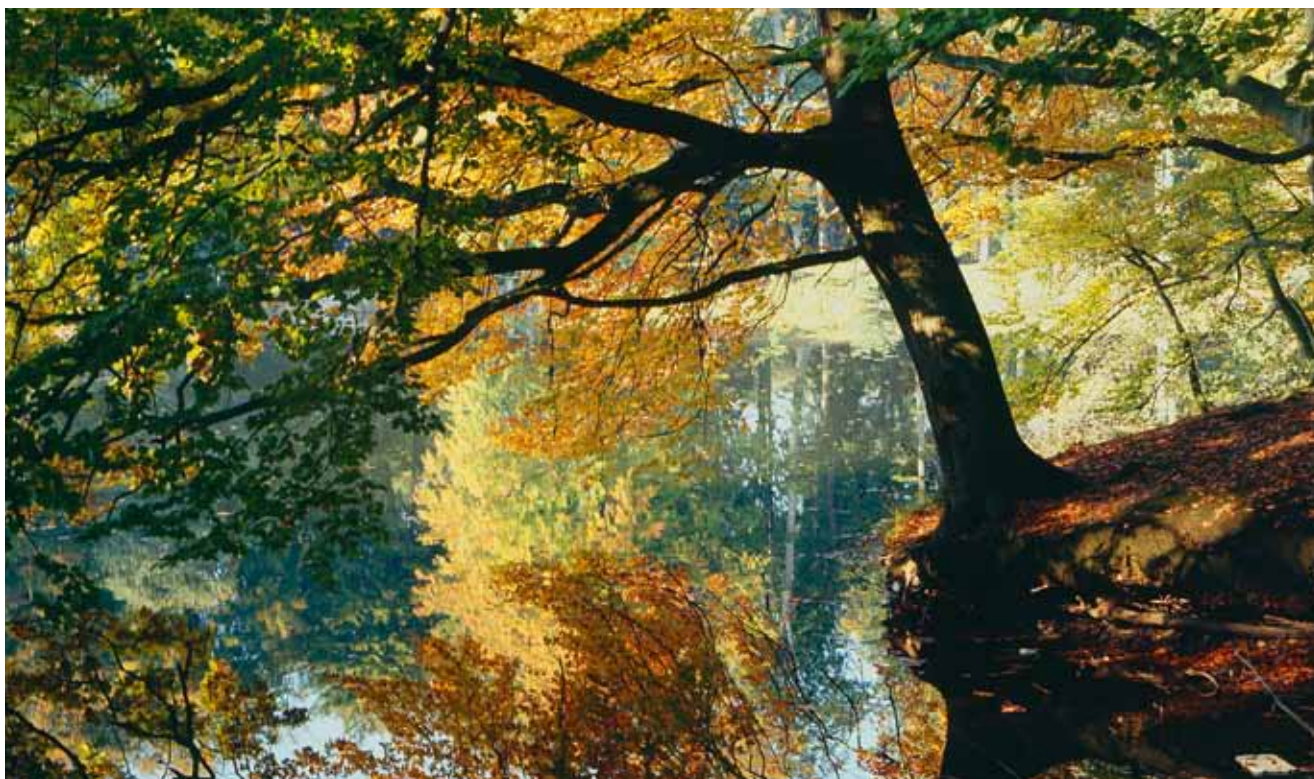
"Nu falmer skoven trindt om land..."