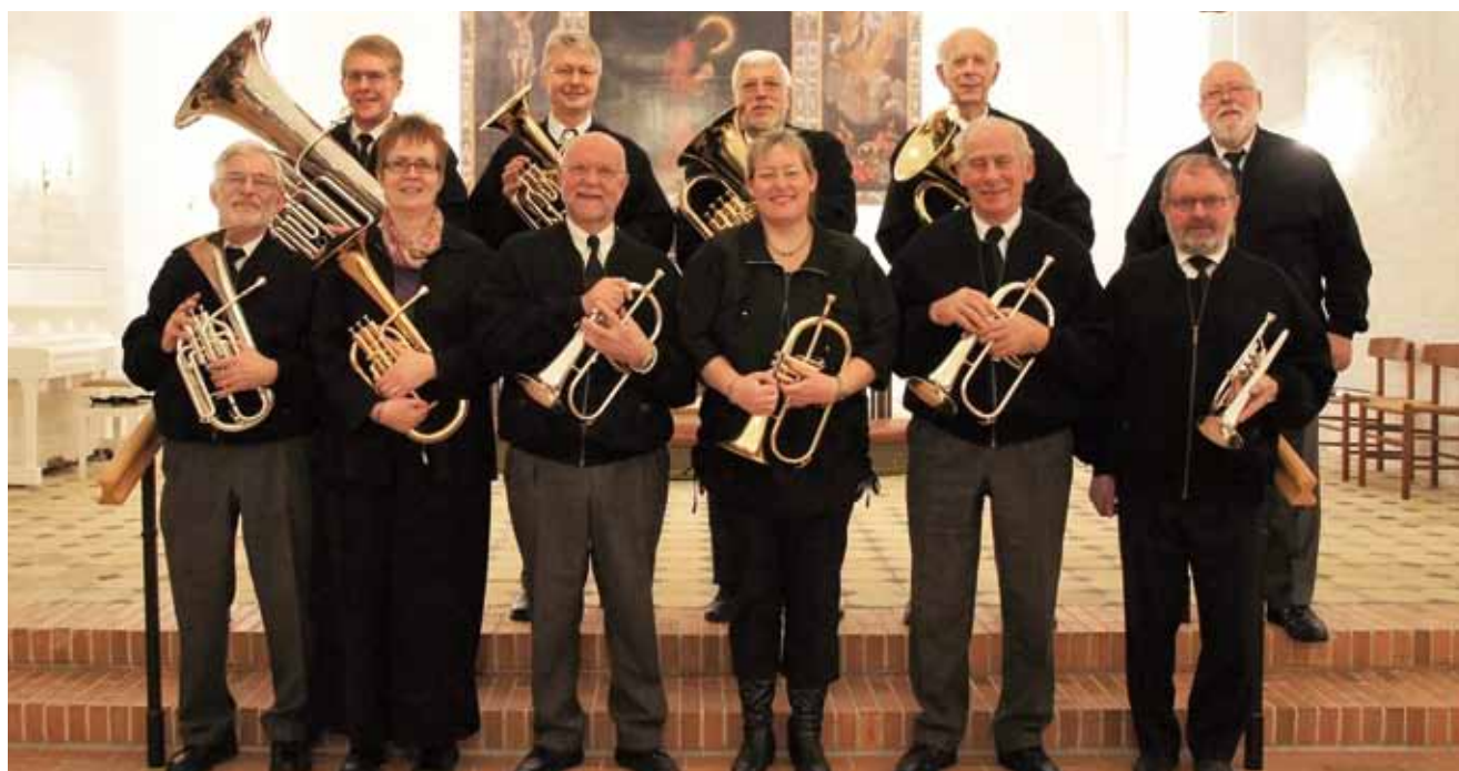
Blæsekoret Pust spiller ved koncerten i Horne Kirke.

Pust er et blæserorkester på 11 musikere + dirigent, der har base i Hobro, og orkesteret har eksisteret siden 1986. Pust har holdt koncerter i omkring 80 kirker i Nordjylland, men også længere mod syd – f.eks. Anklam i Tyskland. Orkesterets repertoire er ret bredt og spænder fra klassiske værker over nyere ting som f.eks. The Beatles, John Mogensen og Kim Larsen, men også musik til påske og foråret indgår i program-