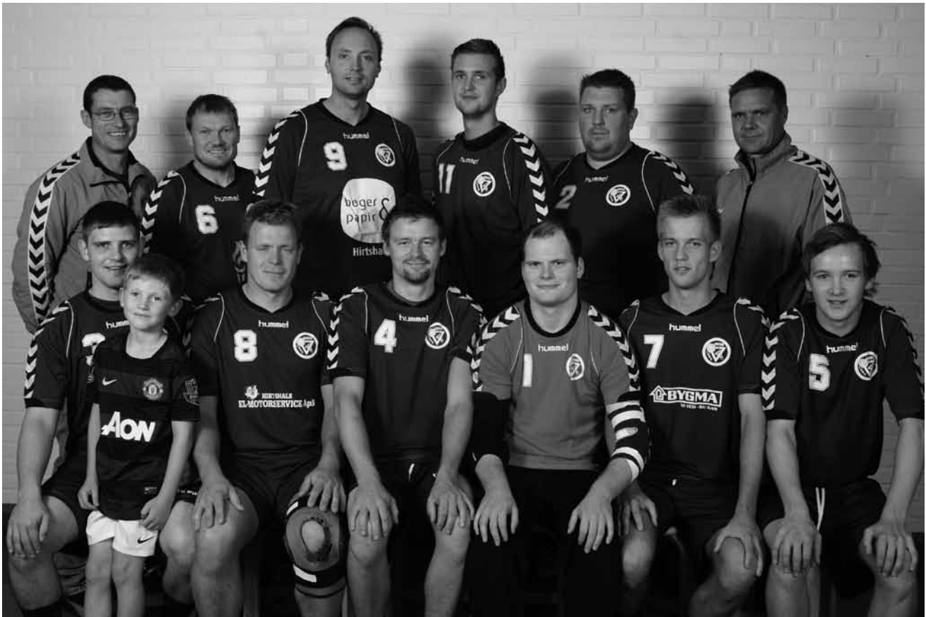
Herre Serie 1.