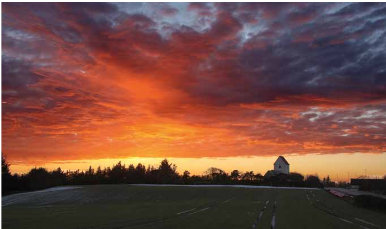
Horne Kirke omgivet af en farverig vinterhimmel.