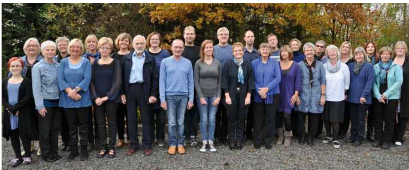
Gospel4You får Asdal Kirke til at svinge.

Tirsdag den 24. januar kl. 19.30 stiller vi skarpt på hvad forskellen er på etik og moral. Hvad er en god moral