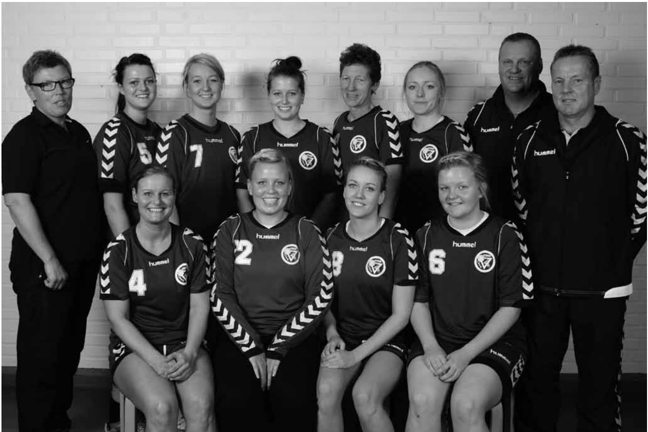
3. division damer

Men det er vi kommet efter – i dag følger vi alle hold helt til "dørs" – hvad angår kondition. Og "Dyssen" – altså Stendyssehallen vores hjemmebane – har vist sig som en bastion for os. Fire hjemmekampe og fire sejre – det må gerne fortsætte sådan. På udebane – ja, det er jo så en anden historie – og den historie vil vi gerne til snart at ændre på. Et point i fem kampe.. av av Men snart er det nytår – og der har man jo nytårsløfter – så mon ikke pigerne har det i tankerne når klokken slår 12. Uha – så bliver vi rigtig farlige for alle hold – og så var det jo godt man "gad" at træne Horne KFUM.