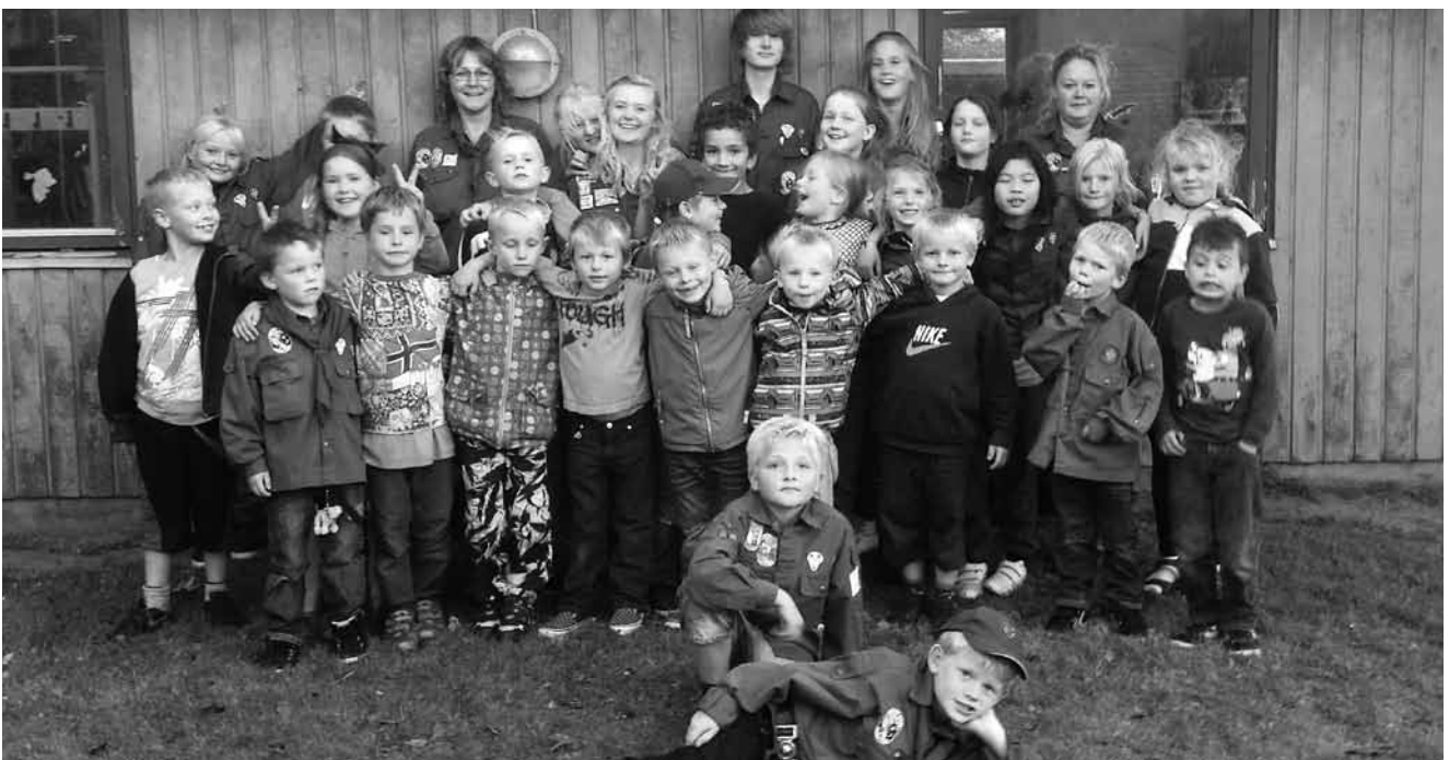
Spejder for en dag d. 4. september, hvor mange nye børn deltog. Vi håber selvfølgelig, de bliver meldt ind, når prøvetiden er overstået.