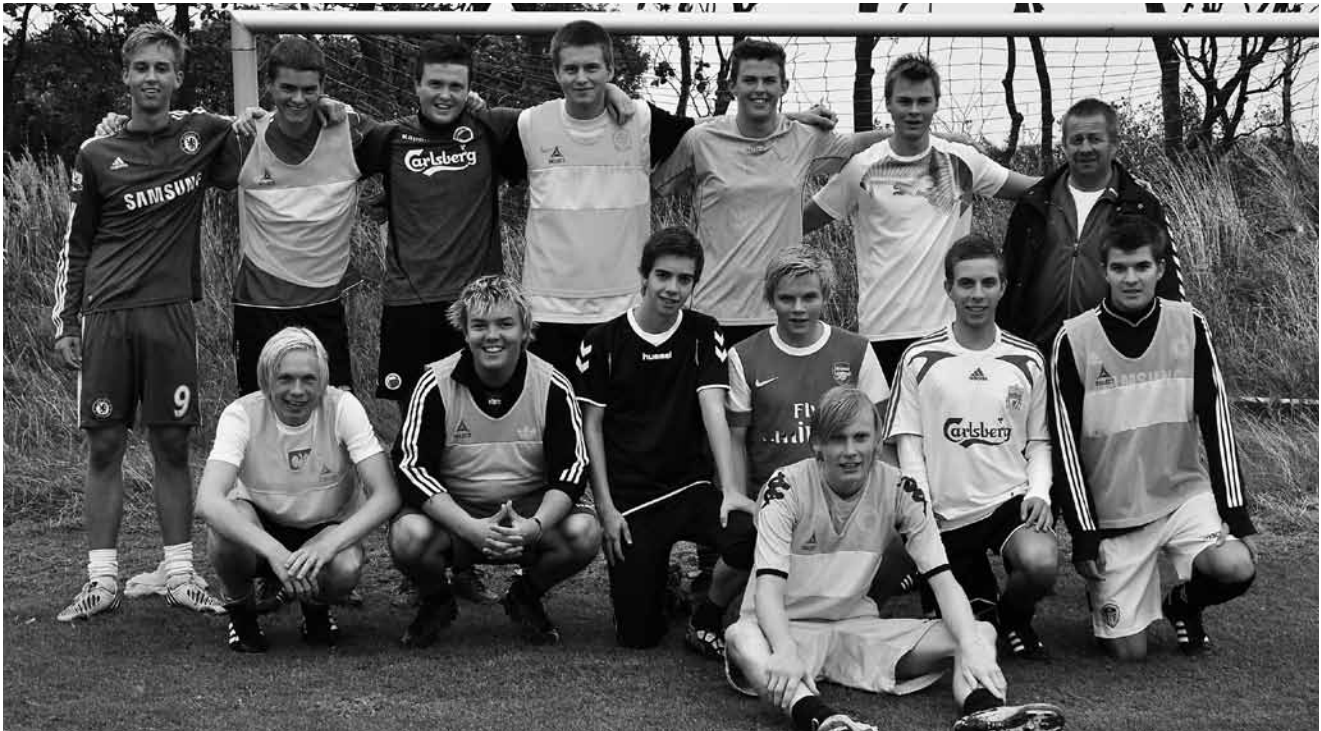
Hele 14 serie 6 spillere til træning i silende regn.

Jeg vil prøve at hitte ud af hvordan man kan ligge billeder på vores del af Badminton People, så det kun er AIF der kan se dem.