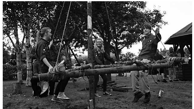
Grønne Marked i august.