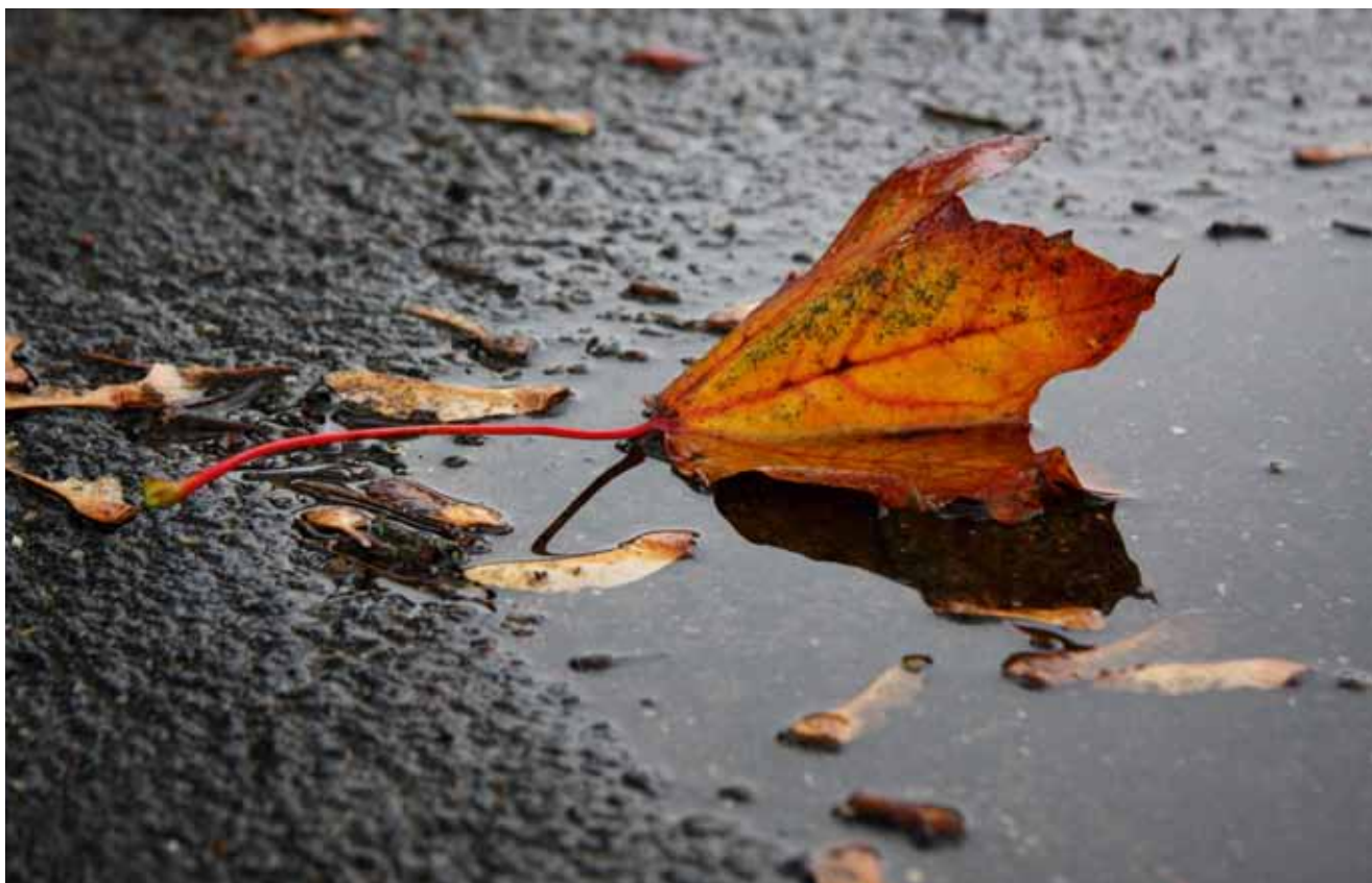
Efteråret set i al sin enkelthed.