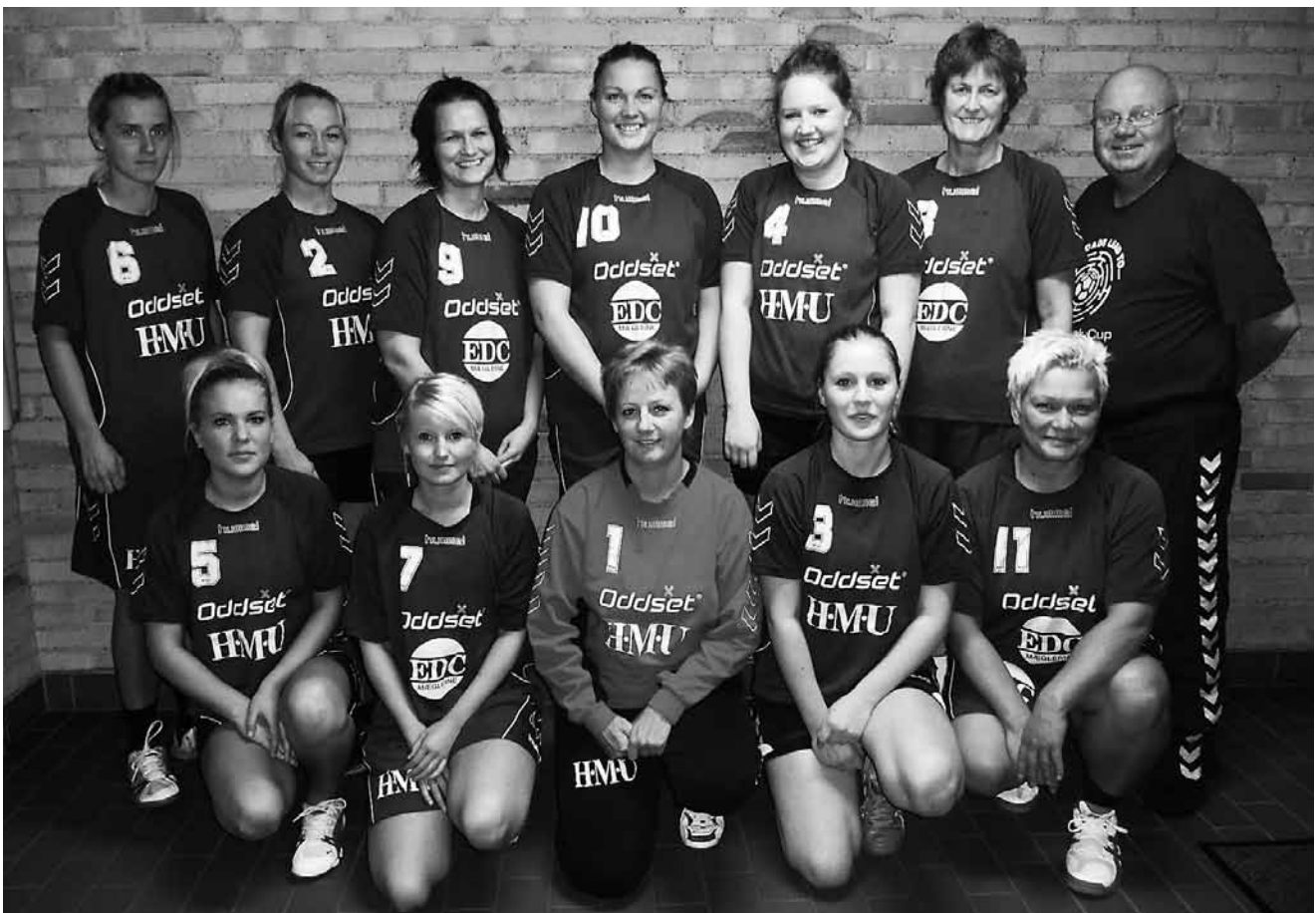
Serie 3 Damer.

Her har vi ikke fået tilgang af nye spillere, og det skal stadigvæk siges, at det er de rutinerede spillere, der trækker det store læs. Med blot et nederlag, desværre til Tårs, uafgjort mod Vrå, har holdet gjort det godt, så også her er vi med helt med fremme. Vi håber på at gå et spændende forår i møde. Også her stor ros til pigerne, der bestemt også spiller seværdig håndbold. Hvis der er nogen, der er i tvivl, så vil holdet vinde, og helst med så stor en margin, som overhovedet muligt. Det kan, eller det gør, at vi ikke altid er helt enige om dispositionerne på og uden for banen, men det er helt OK, når blot vi i den sidste ende opnår et fælles