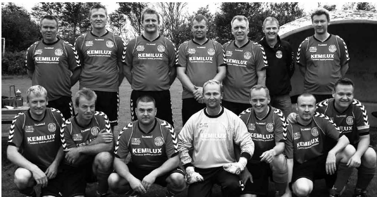
Oldboys - de unge.

God jul og godt nytår fra fodboldudvalget