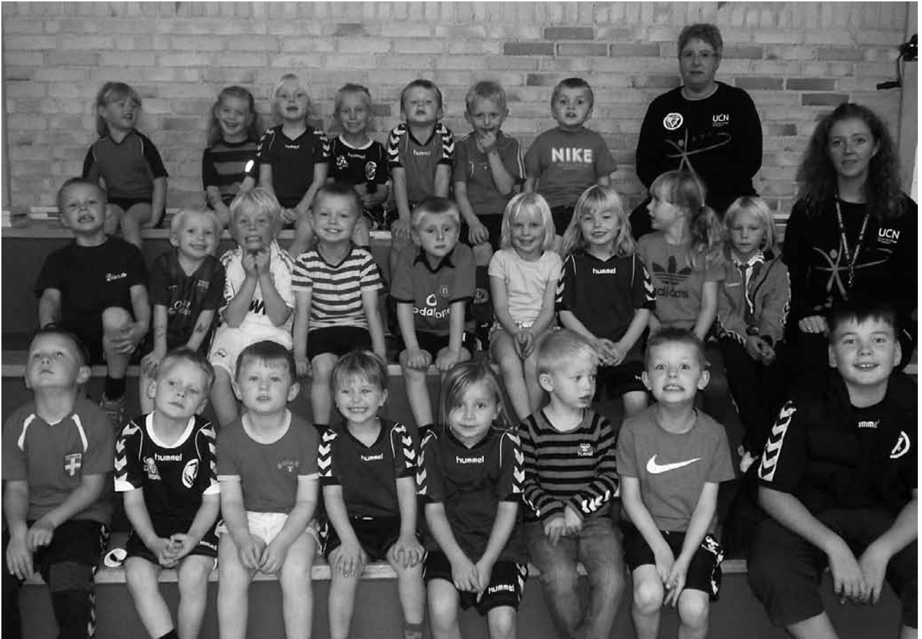
U8 og U10.