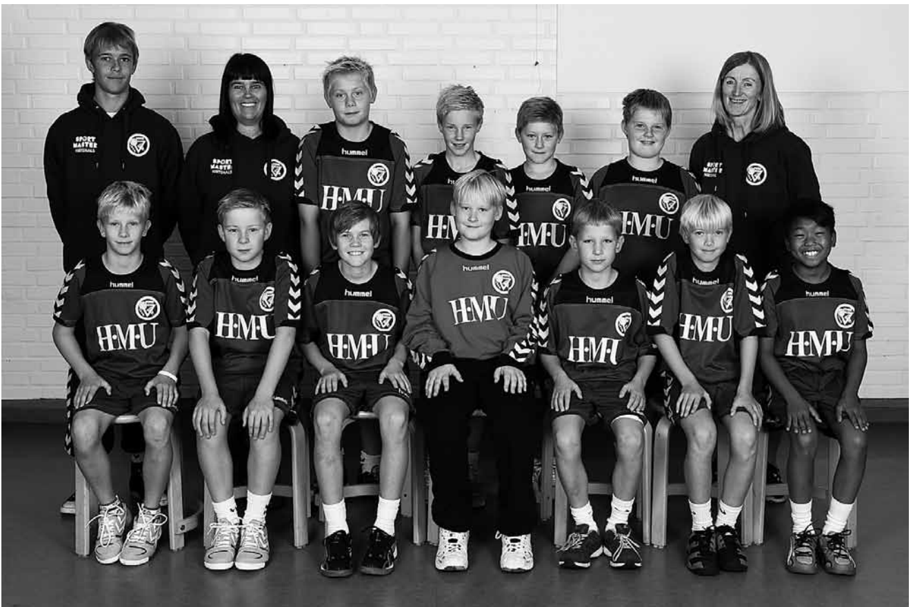
U12 Drenge 2.