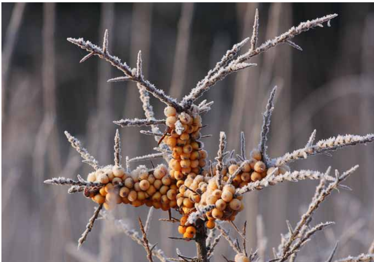
Klittens havtorn pudret med vinterens rimfrost.