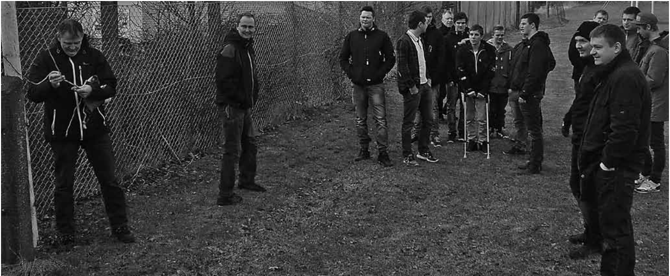
Standerhejsning i fodbold den 2. marts 2013

Nogle virkelige fine resultater, der viser, at I er med blandt de allerbedste i jeres årgang.