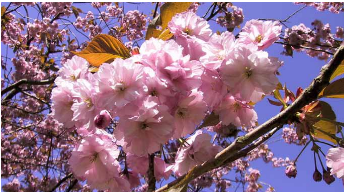
Midt i foråret står Japansk Kirsebær i fuldt flor - motiv fra haven ved Horne Efterskole.