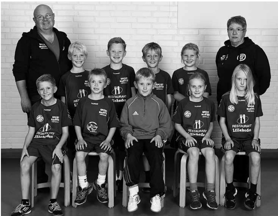
U 10 Drengene

Fra Horne KFUM's hjemmeside om fodboldcuppen i pinsen (PondusCup hed den de første år, så Danske Bank Cup, og nu tager den navneforandring til Slagter Winther Cup – det betyder dog ikke, at navnet i folke-munde ændres natten over, - der er fortsat hjælpere