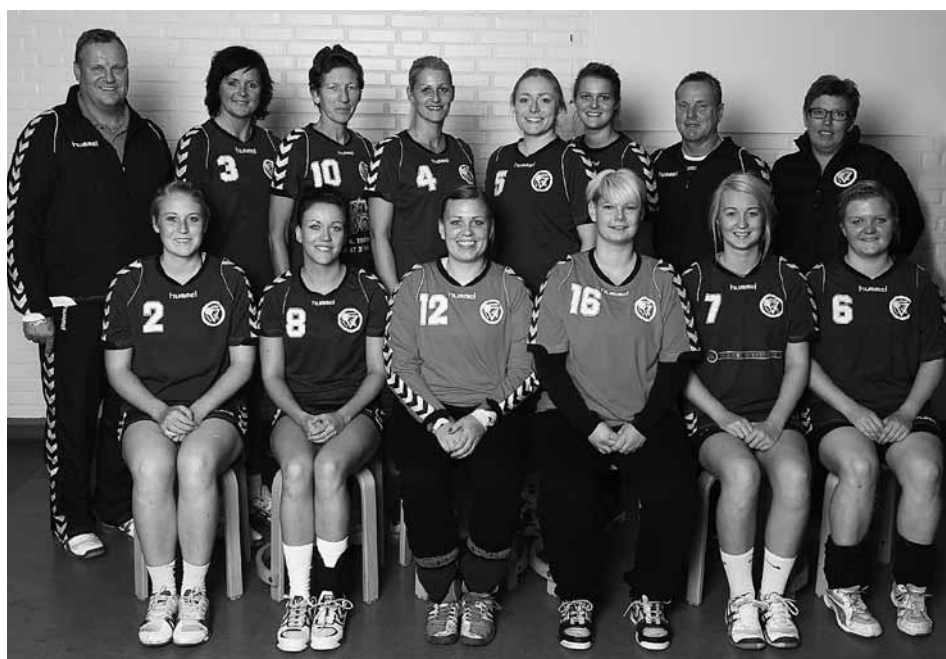
3. divisions damer

Vores hold består af 8 markspillere og 1 målmand, samt en U-18 målmand til låns engang i mellem. Selv i 3. division er det en meget smal trup. Det er simpelthen nødvendigt med alle spillere til hver eneste kamp – hvilket vi også altid er, heldigvis. Mange vil undre sig over, at vi faktisk ligger øverst i tabellen, hvis de så hvor få, vi er til træning. Det er selvfølgelig frustrerende for de spillere, der kommer til træning hver gang, at