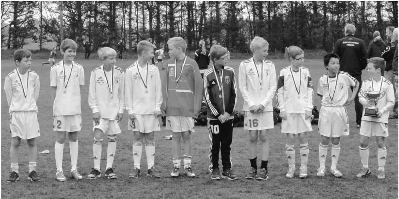
Hirtshals U12 drenge