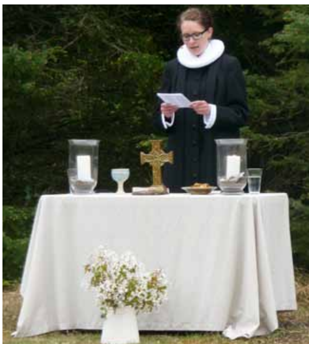
Fra gudstjenesten i Tornby Klitplantage 2. pinsedag.

"En aften på Hellehøj" onsdag den 3. juli kl. 19.00 på Hellehøj. Traditionen tro holdes der friluftsgudstjeneste på Hellehøj ved Asdal, hvor lærere og kursister på harmonikakurset på Horne Efterskole medvirker. Efter gudstjenesten vil lærere og kursister spille op til folkedans. Medbring stole/tæpper. Kaffe, sodavand, pølser og kage kan købes. I tilfælde af regn bliver aftenen holdt på Horne Efterskole. Aftenen arrangeres sammen med de forskellige foreninger i Asdal og Horne.