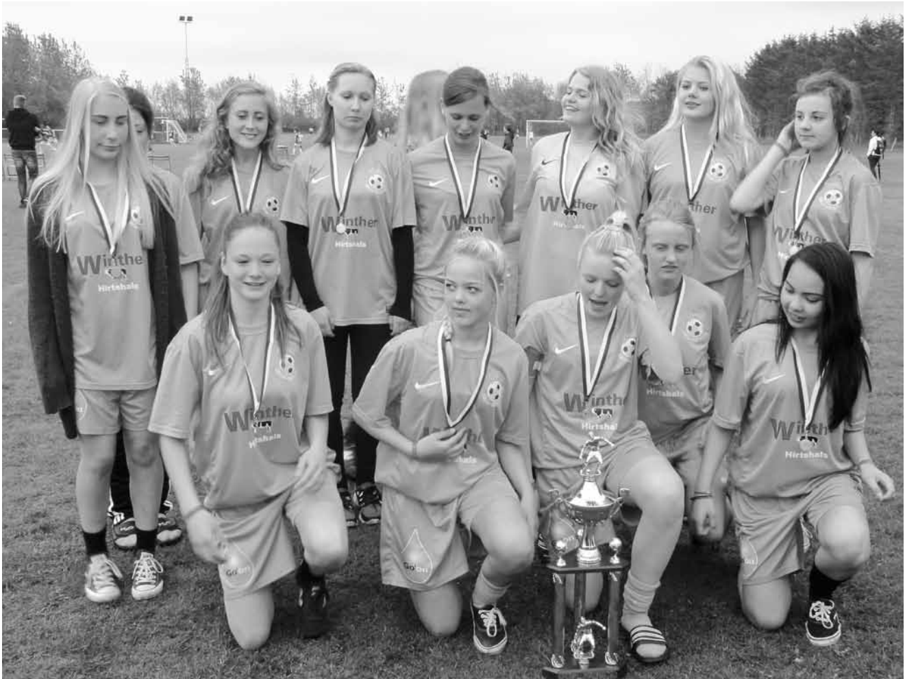
Horne-Hirtshals U15 piger

U 17 drenge: Horne Hirtshals 1, Horne – Hirtshals 2, Ikast FS