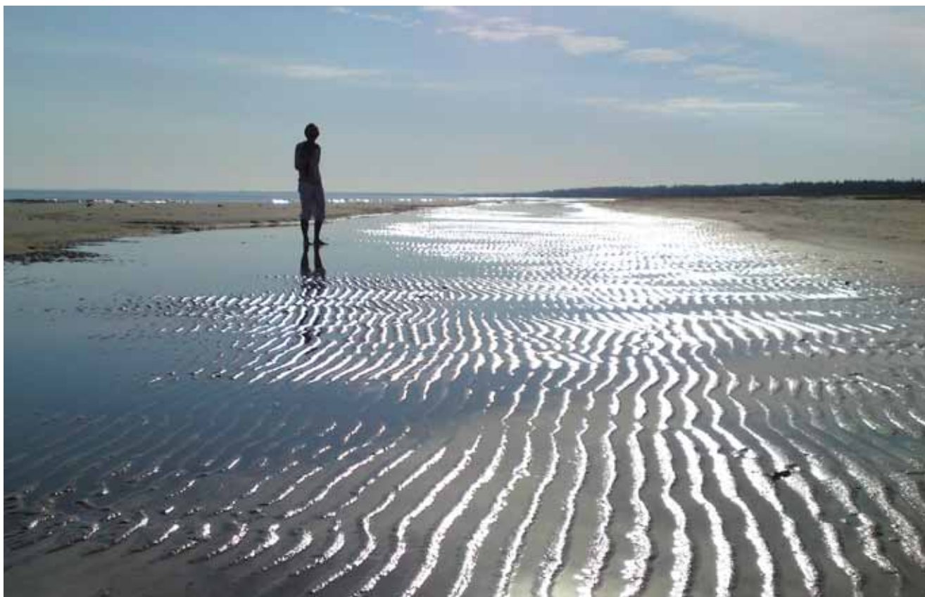
Sommerens lave morgensol kaster smukke sølvstriber i kystens strandsøer