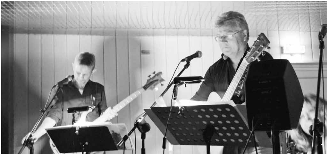
Nightcap spillede helt fantastisk.