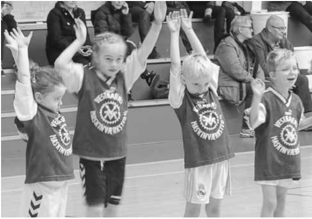
U 8 stævne.

hæng i hverdagen for alle skoleelever, så folkeskolereformens intention om en skoledag for alle fra 8 – 16.00, hvori der også indgår fritidsaktiviteter, kan man teoretisk set kun glæde sig til.