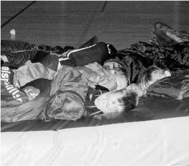
Sovende børn fra natbadminton.