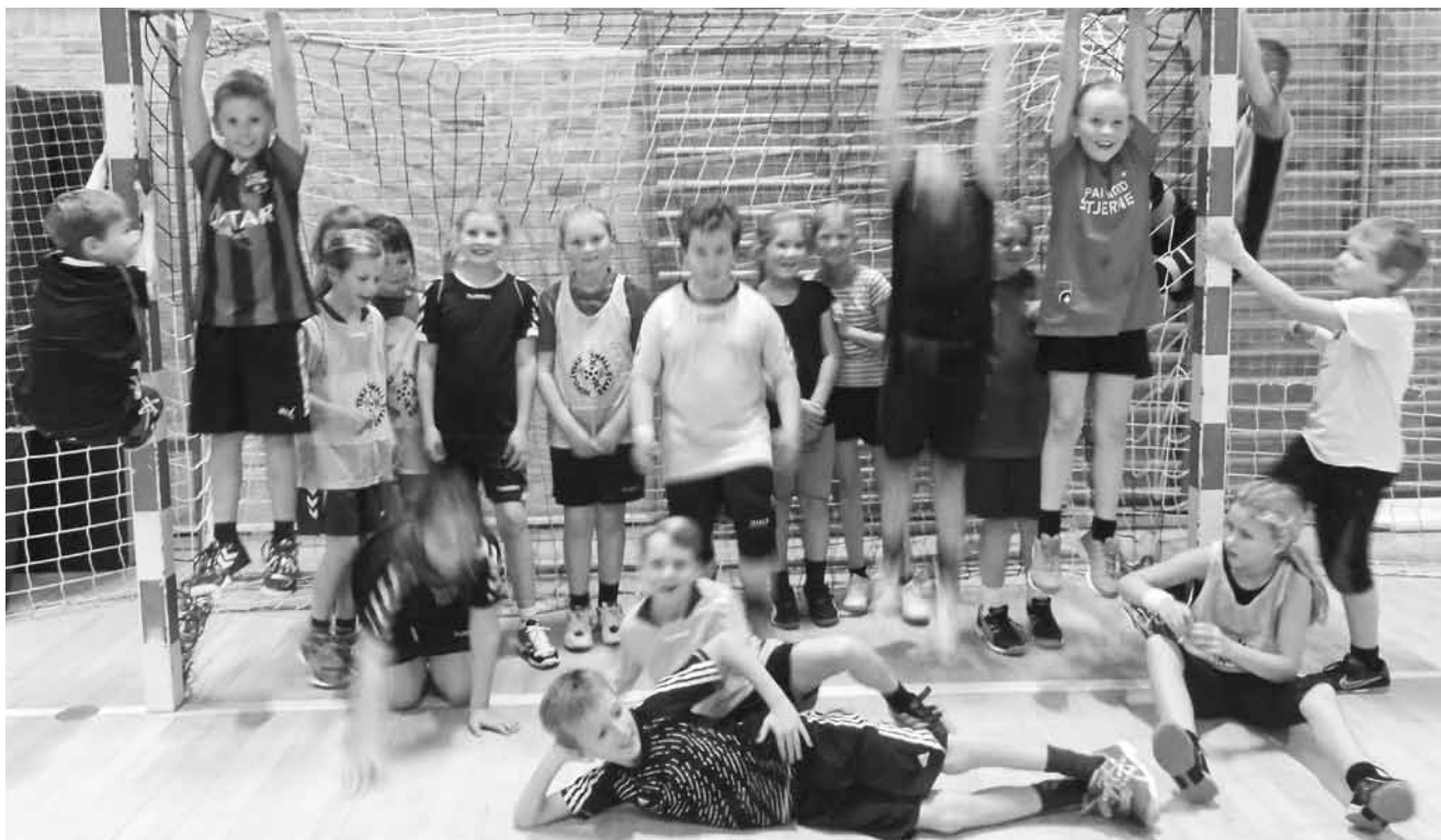
U 10 drenge og piger.