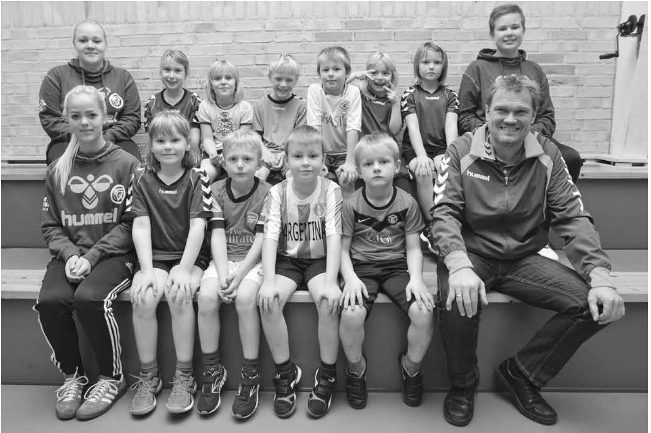
U 6 og 8 drenge og piger