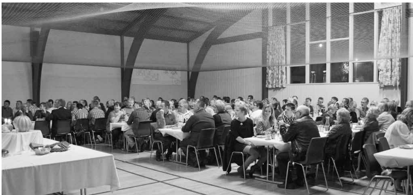
Folk lyttede til velkomststalen fra formanden (salen var fyldt).

Aktivfesten den 2. november i Asdal Sognegård blev en kæmpe succes, hvor "Nightcap" spillede op til dans. Jeg personligt har aldrig set så mange mennesker til aktivfesten før! Der var dækket op til 161 personer, og vi må nok sige at det vist er "loftet" for tilmeldinger.