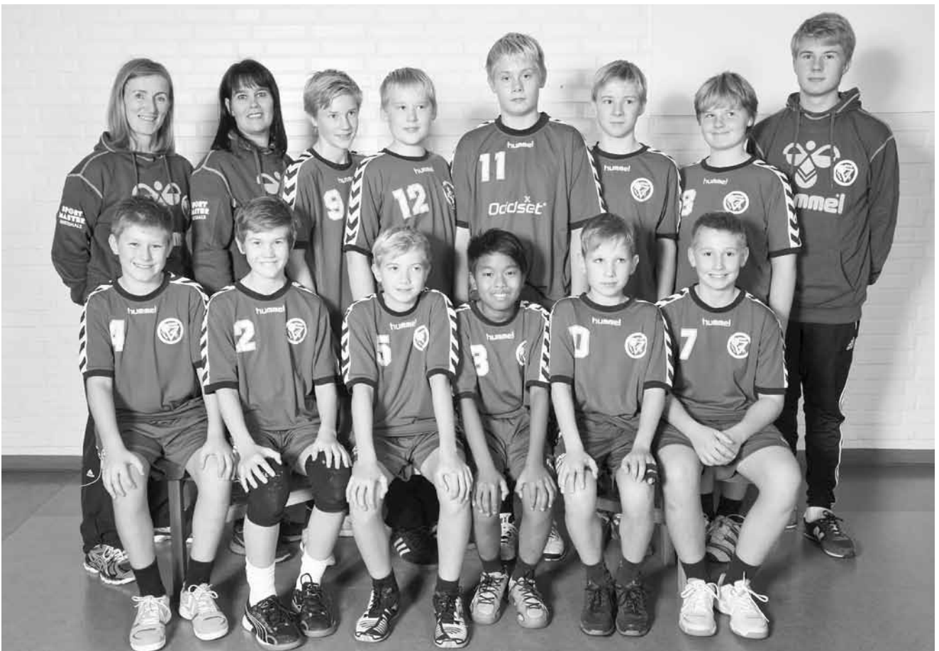
U 12 drenge