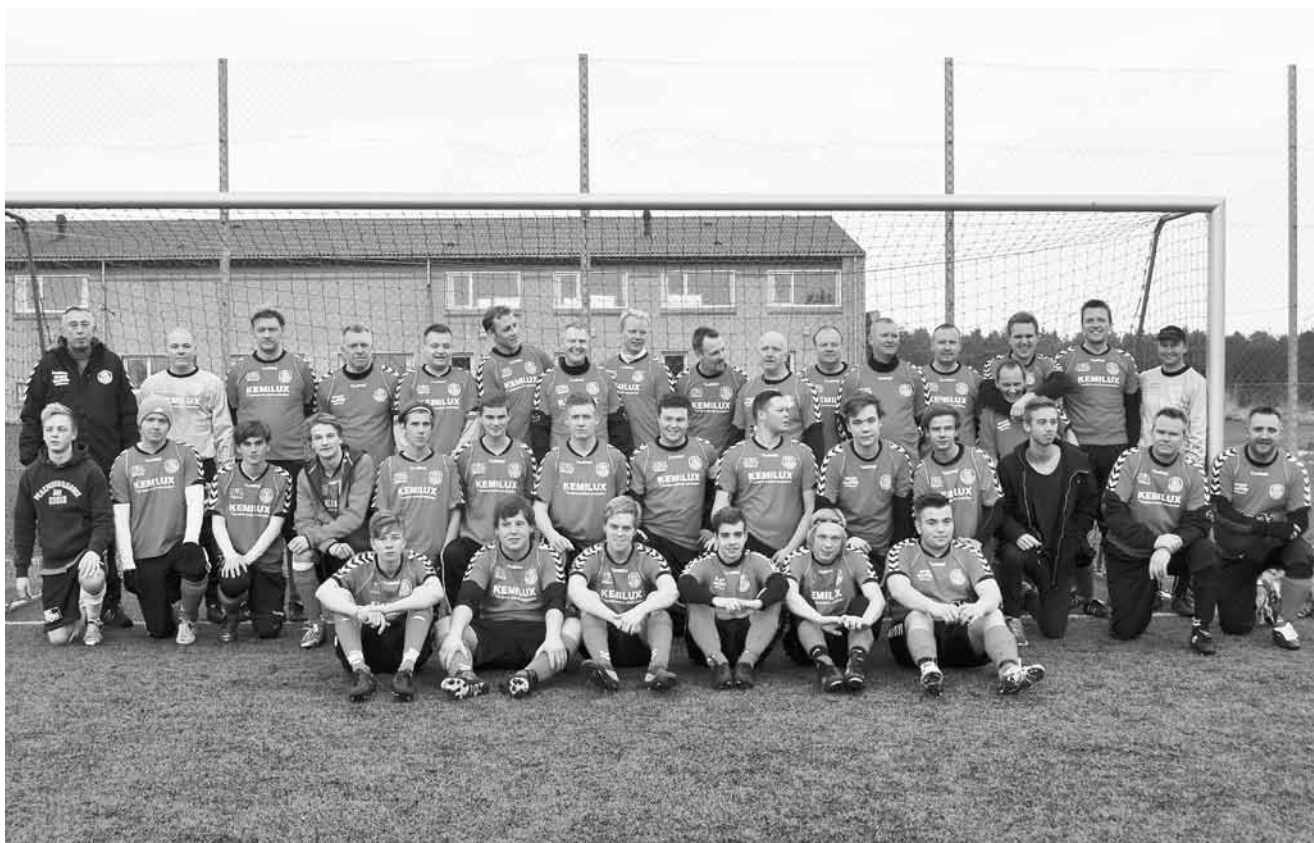
Standerhejsning når det er bedst.