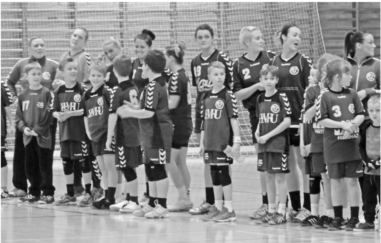
Pokalkamp håndbold 3. division

Træningsmæssigt kan man ikke prale af, at vi er mange hver gang, men vi sniger da os på at være 10-12-14 stykker, og nogle gange ser vi endda halinspektøren træne med.(som regel dog kun når han ved, at vi ikke skal løbe!) Man kan også se på dåbsattesten for nogle, at de er ved og være oppe i alderen, selv om de ikke