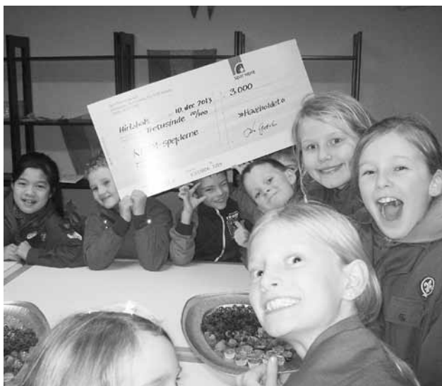
Glæde over check fra haveholdet.

Troppen forbereder sig på DM i Spejder, hvor der den 25.-27. april er Den Nordjyske Kvalifikation på Thorup Hede. Som forberedelse har troppen været afsted på bootcamp et par gange. Første gang var det blot