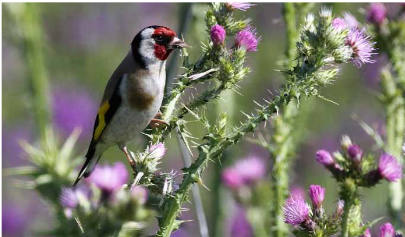
Påske - Sangfuglen stillits er i den kristne kunst et symbol på korsfæstelsen (se næste side!)

April, maj og juni er i år fyldt af en masse forskellige helligdage. Nogle gange kan det godt være lidt svært at holde styr på dem, så herunder er der en oversigt over de forskellige dage. Man kan læse om de fleste af dem i Biblen; i Matthæus-, Markus-, Lukas- og Johannesevangelierne og i Apostlenes Gerninger i Det Nye Testamente. Man kan selvfølgelig også komme hen i kirken og høre alle de forskellige fortællinger.