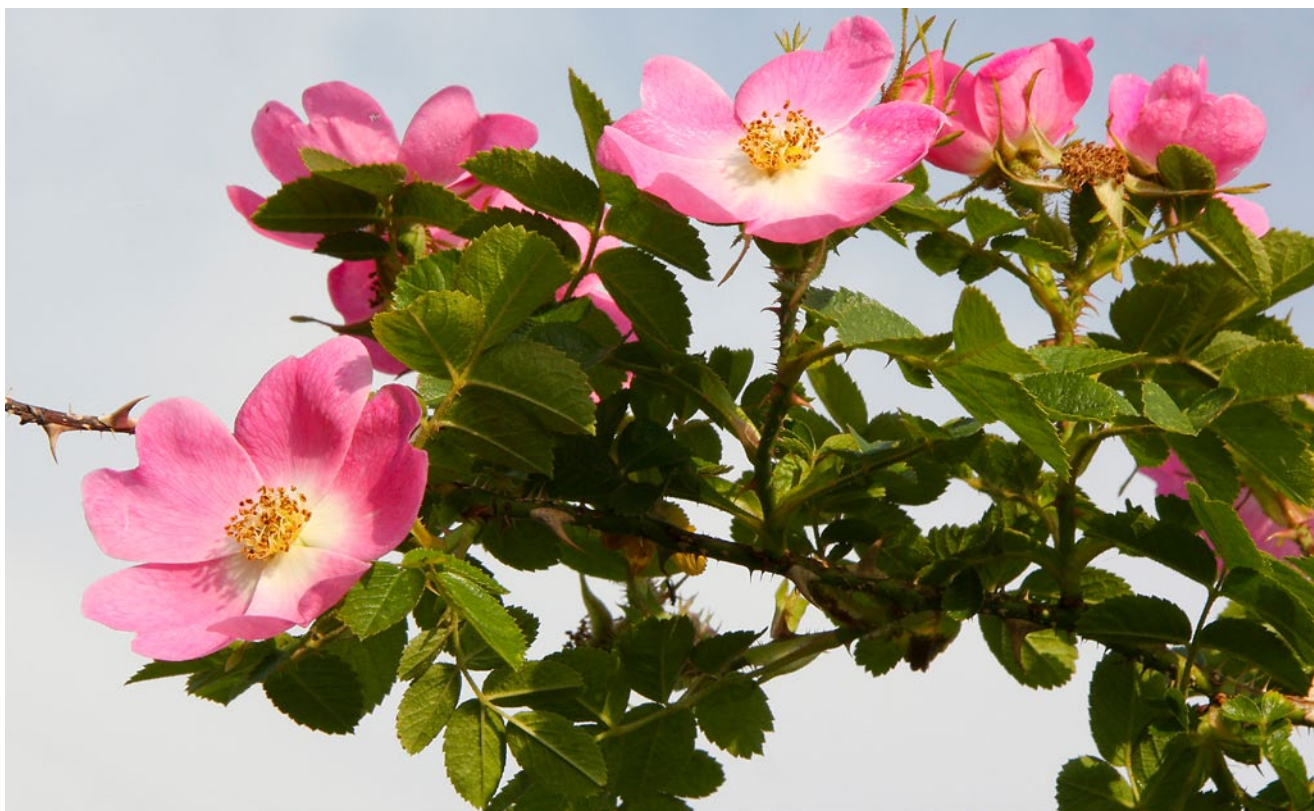
Højsommeren er tiden med mange rosenarter i fuld flor bl.a. hunderosen med de blegrode blomster.