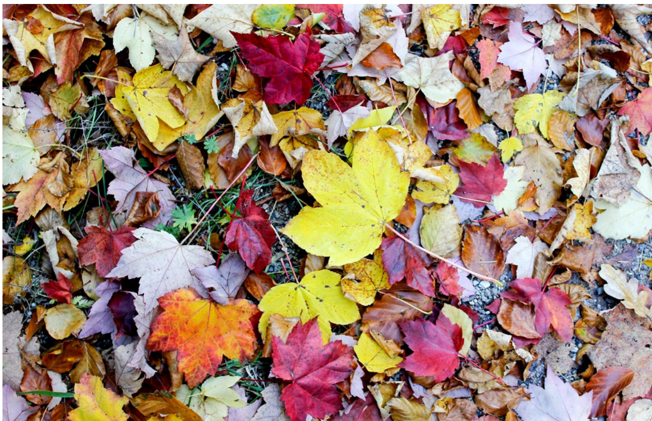
Efterår - atter dækkes skovbunden af det farverige løvfald.