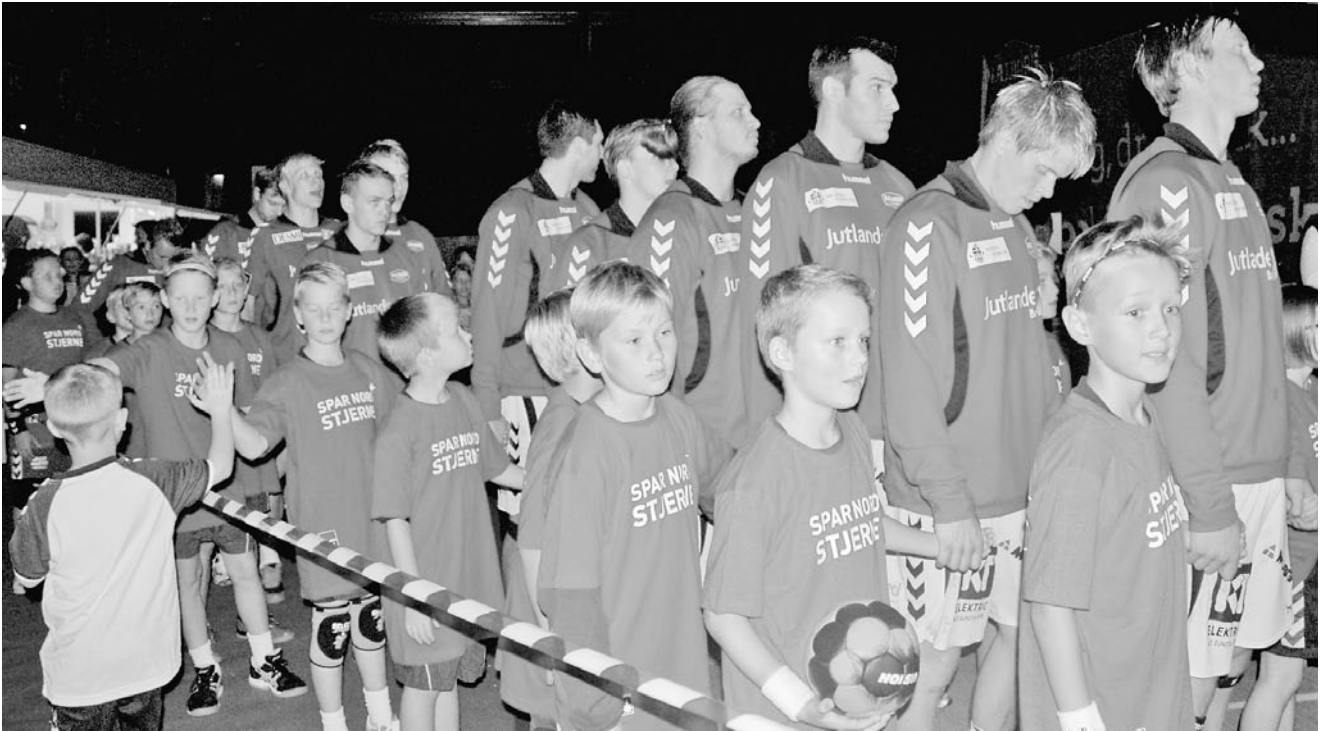
Små stjerner i Aalborg.

Serie 4, var det ikke kun et skuffende resultat, resultatet betød også, at Hornes førstehold glippede den direkte tur tilbage til Serie 4 på grund af en ny regel hos DBU Jylland. Forud for de sidste kampe blev det besluttet, at det i modsætning til tidligere år ikke var pointantallet, der blev afgørende, men derimod pointgennemsnittet. Det kom til at betyde, at vi på trods af seks sejre mod samtlige andre hold end førstepladsen og en suveræn 2. plads i puljen, blev forfordelt i forhold til puljer med flere hold.