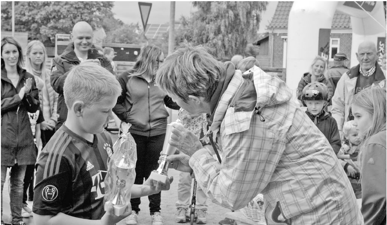
Vinder 2014 Tour de Skansebakken.