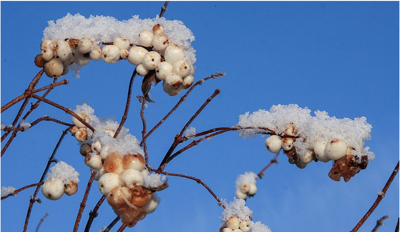
Vinterens snebær lyser op i mange levende hegn.