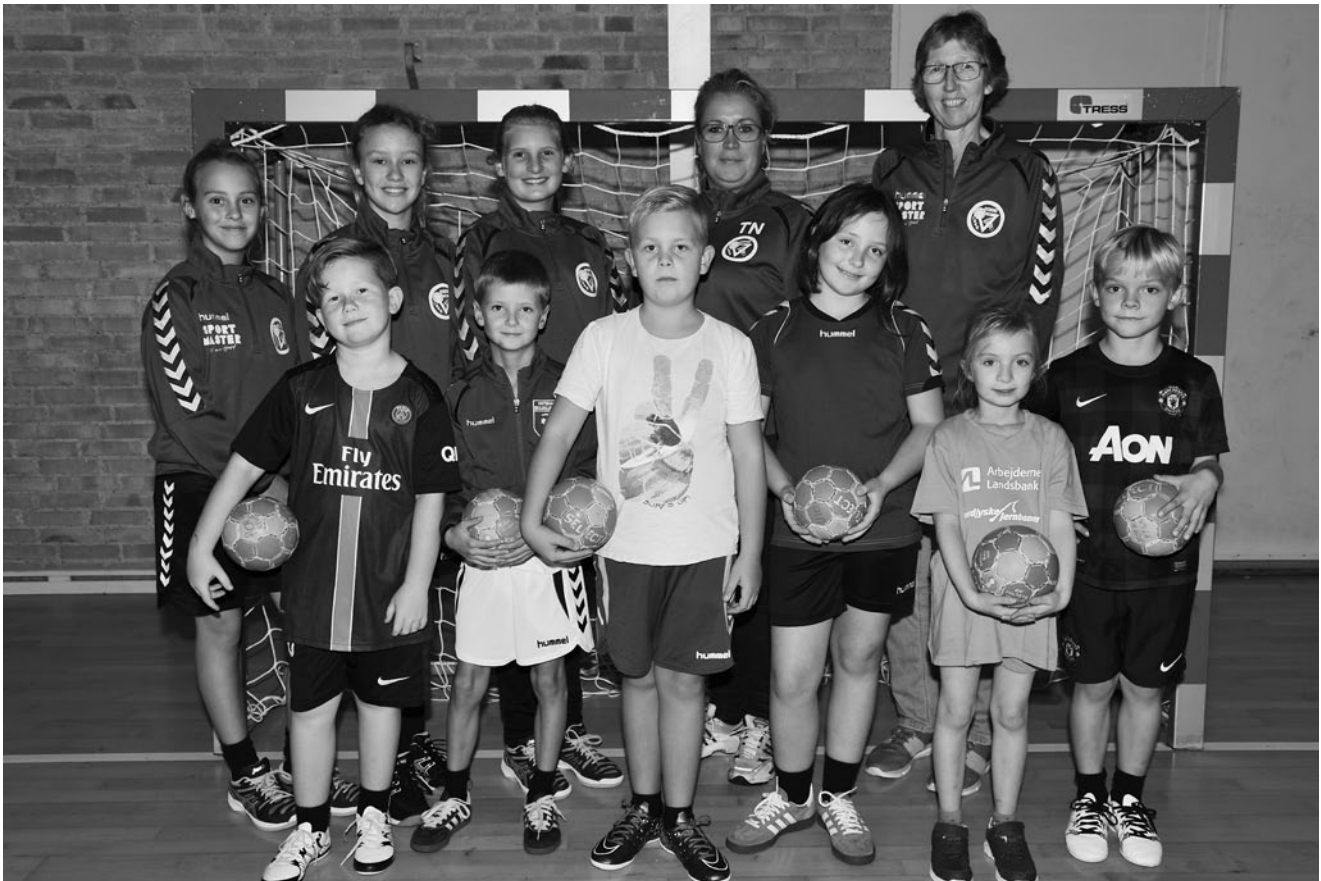
U6 og U8