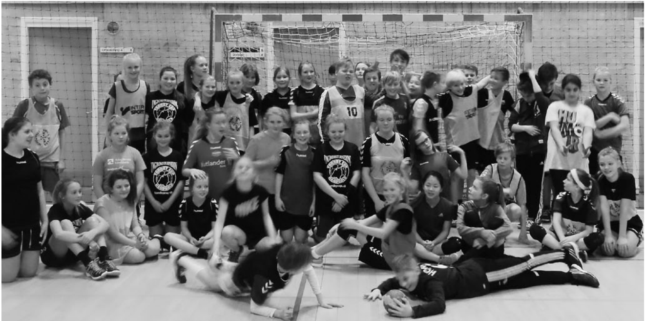
Natstævne U 12 spillere