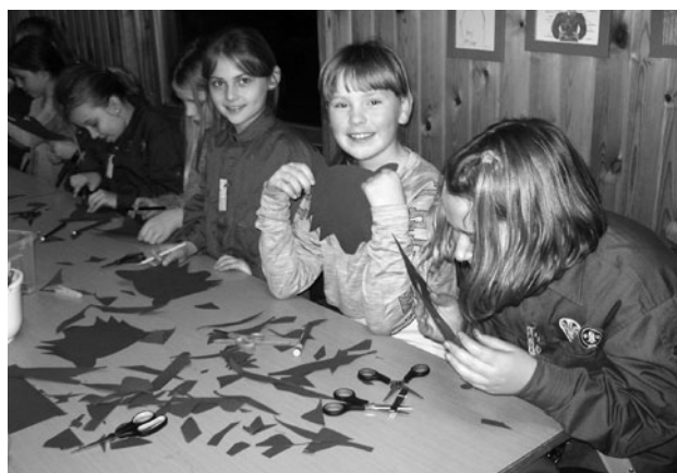
Ulvene laver ulvemasker.

Ulvene har gennemgået reglerne omkring dolke – hvordan man omgås sådan én, hvordan er det bedst at sidde, når man snitter med en dolk, samt i øvrigt talt om sikkerhed m.v., og de har nu alle et dolkebevis. De har også lavet ulvemasker, fået hver sit ulvenavn og øvet spejderråb.