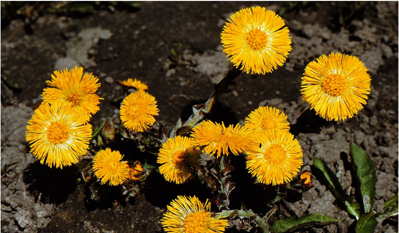
I det tidlige forår, allerede fra marts, kan vi glæde os over følfods gule blomsterkurve. På afstand ligner de små mælkebøtter.