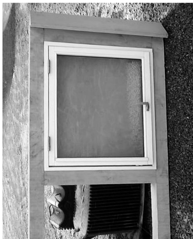
En af infotavlerne før opsætning.

Tak til Trolle-Byg, som har sponseret begge to. Alle foreninger er velkomne til at sætte information op i standerne.