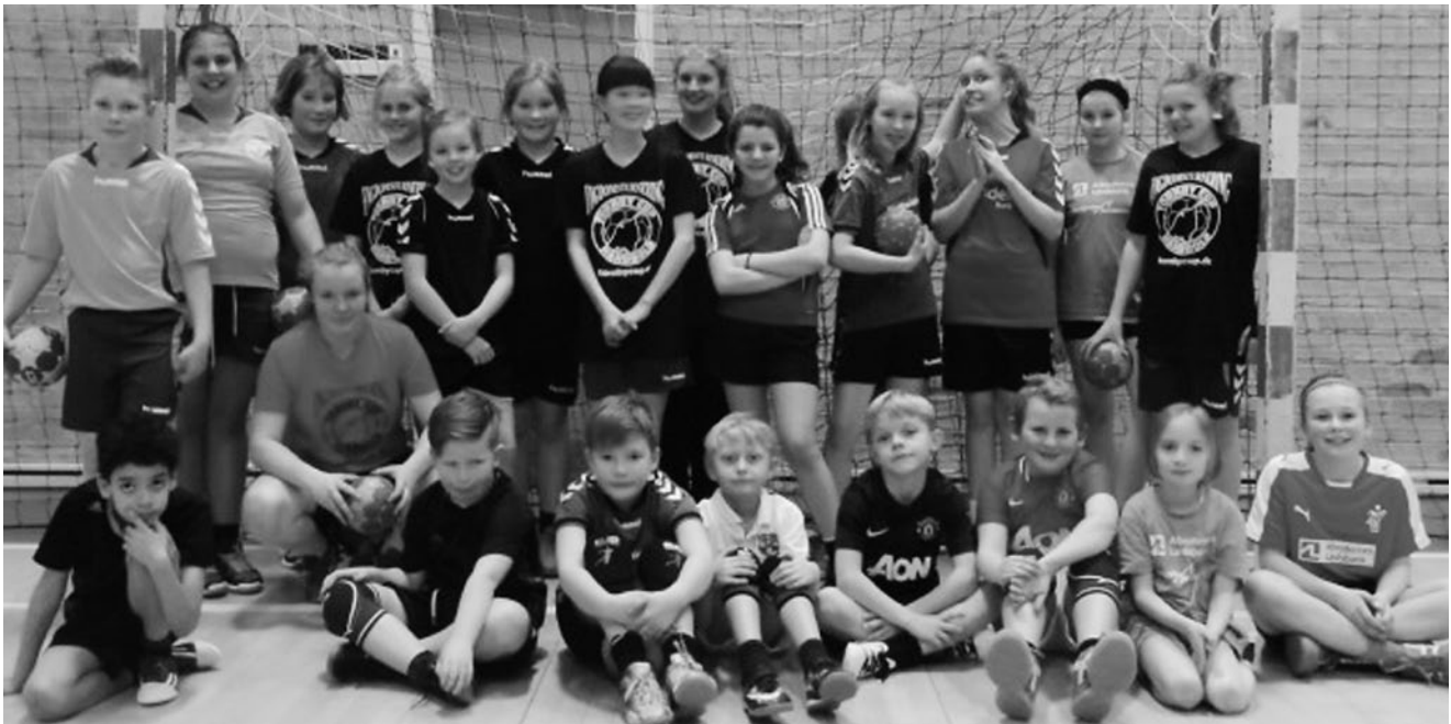
Træning U 12.

tid af alle på at give deres kærlighed til spillet videre til et nyt kuld unge mennesker.