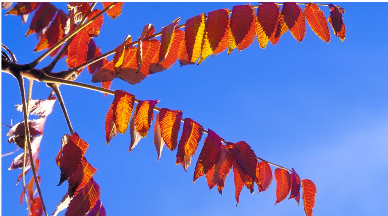
Efterårets røde, gule og orange farver ses i fine nuancer på hjortetaktræets blade.