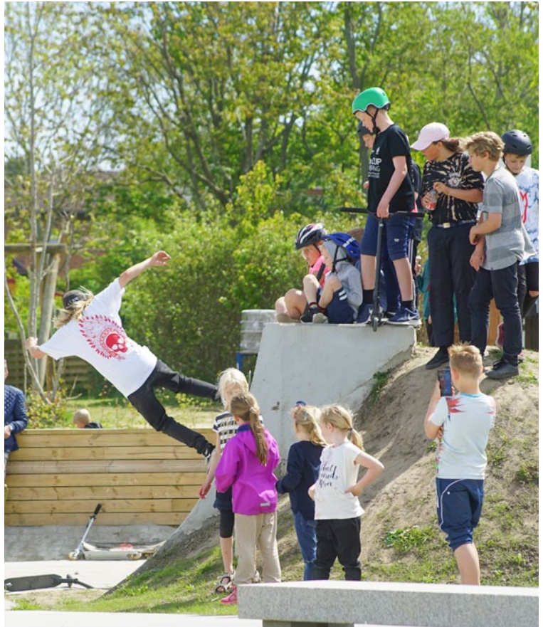
Professionelle skatere fra Aalborg, fik mange gæster til at holde vejret, da viste deres halsbrækkende tricks.