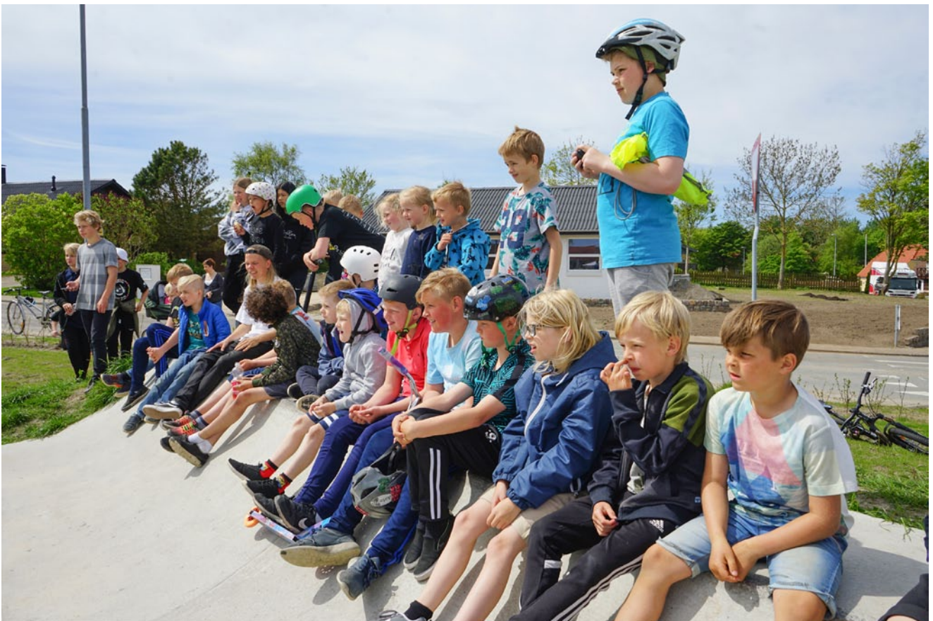
De mange fremmødte børn og unge fik mulighed for at dyste om "bedste trick" på skateboardbanen.