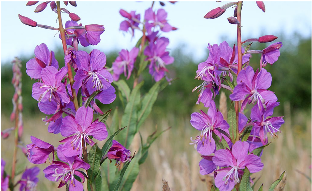
I højsommeren står gederams i fuld flor. Planten optræder ofte i massevis og dens lilla farver præger landskabet på lang afstand - ses meget flot på Hornestien.