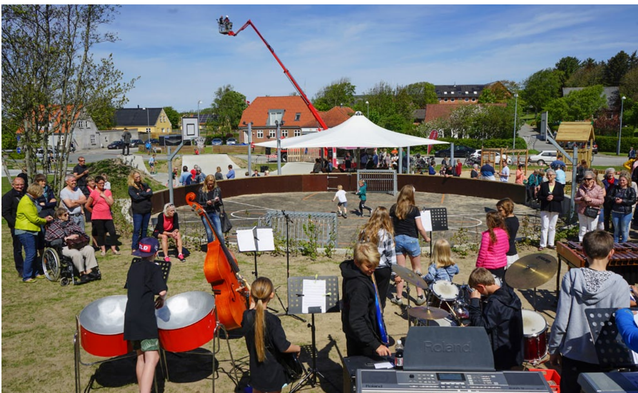
En god dag på Det Grønne Hjørne.