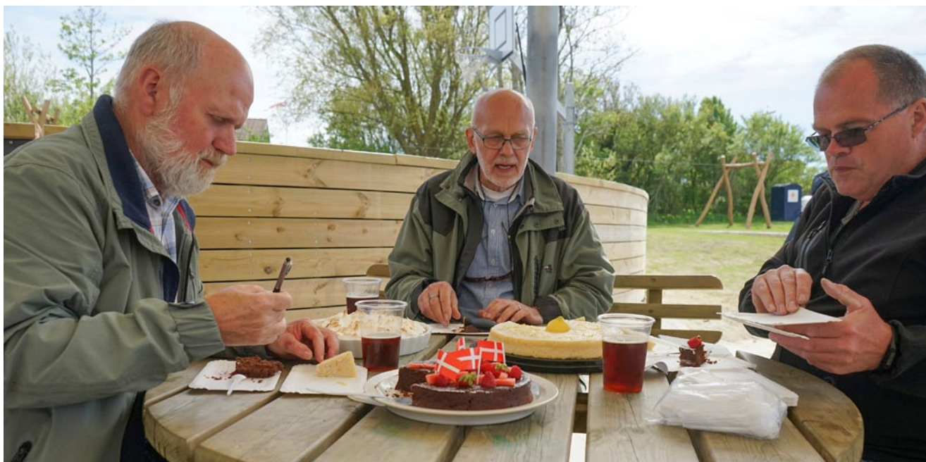
De grå mænd var dommere ved kagekonkurrencen.

Beboerforeningen vil også i år være medvirkende i Tour de Skansebakken, der afholdes 27. august på Det Grønne Hjørne. Der vil være salg af kage, kaffe, øl, vand og pølser på pladsen. Overskuddet går til vedligehold af Hjørnet.