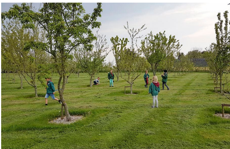
I naturen med bæverne.